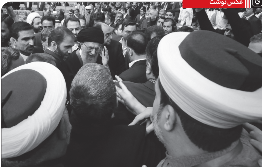
حضور و سخنرانی رهبر انقلاب اسلامی در ششمین کنفرانس بین المللی حمایت از انتفاضه فلسطین، ۱۳۹۵/۱۲/۳